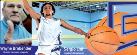
Wayne Brabender Director campos y jugador