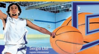
Sergio Llull Jugador Internacional